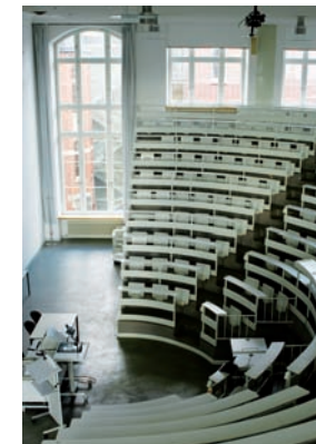
Campus Charité Mitte